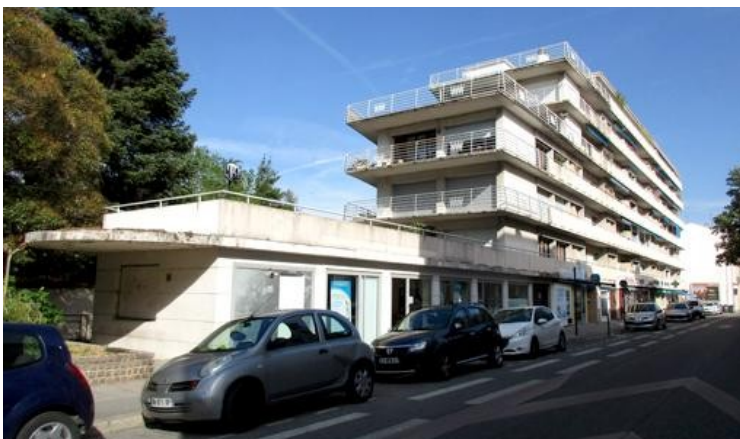
Mémoire de la Drôme - mai 2019

Une première demande de permis de construire, en janvier 1957, faisait suite à un premier projet élaboré en 1956. L'architecte valentinois Pierre DUTOIT avait imaginé un immeuble en forme de paquebot avec un rez-de-chaussée en forme de pont sur lequel s'élevaient quatre étages, puis deux autres en retrait. De larges terrasses et balcons venaient compléter la référence navale. La ressemblance avec le bateau était frappante. Cependant les différentes hauteurs envisagées, et les distances par rapport aux limites séparatives avaient conduit la Direction des Services Départementaux alors en charge de l'instruction des dossiers à refuser ce premier permis. Des rectificatifs suivront et la construction pourra enfin commencer.